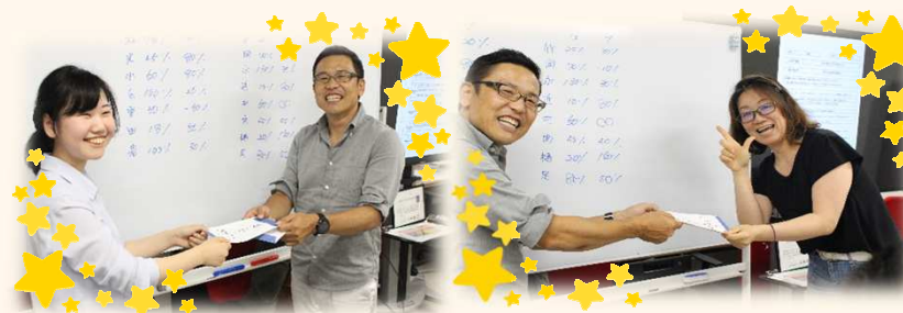
▲ 仕事目標表彰 足立