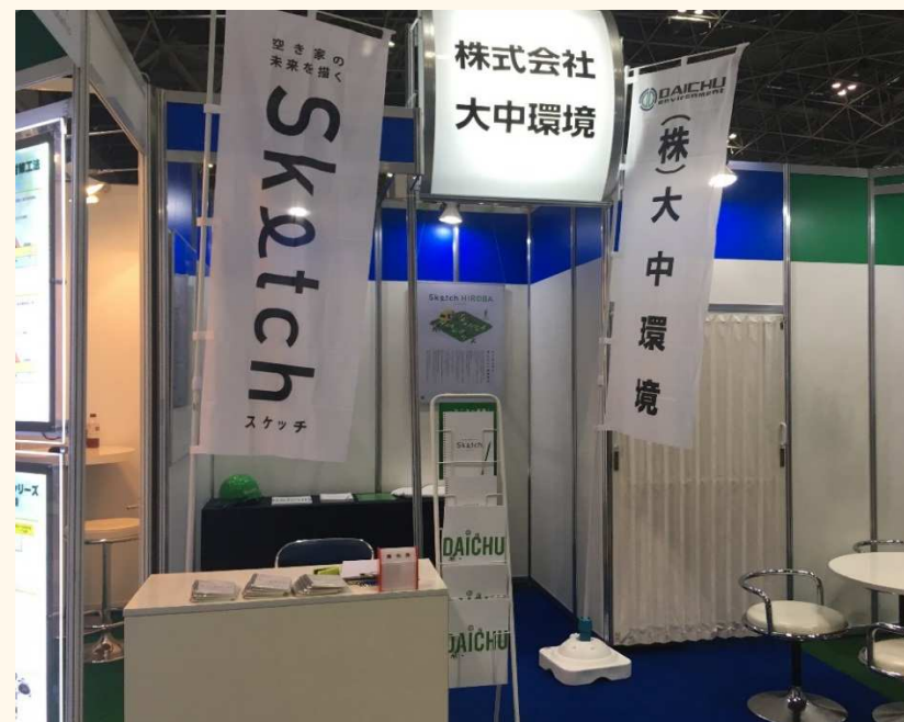
▲ビッグサイト内弊社ブース

他社のブースには、大きな重機や車両、機械が設置されており、弊社のブースとは迫力が違いました。